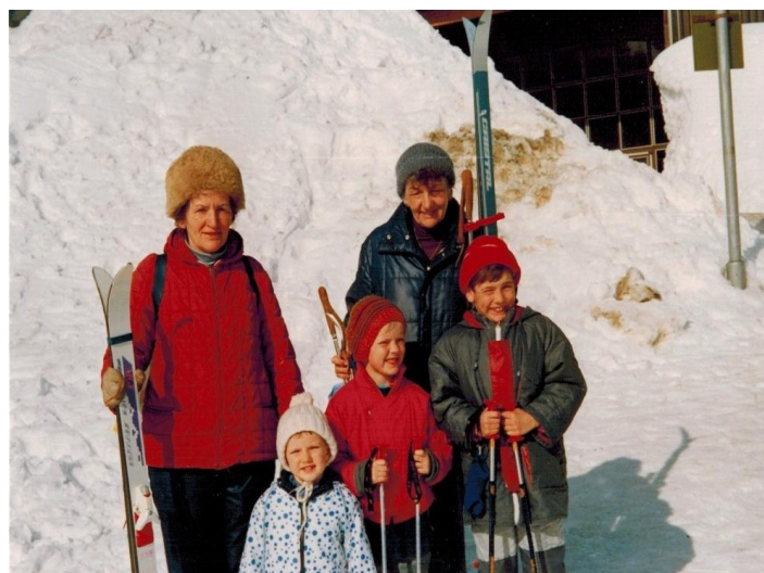
... ale s generací starší