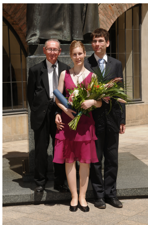
Jedna z mnoha promočních fotek