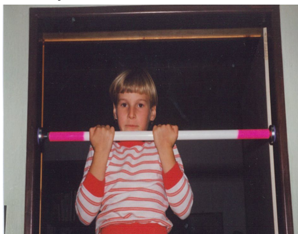
Zuzanka ráda posiluje ...