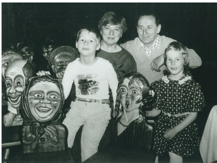
Občas jsme na dovolené nebyli s rodiči ...