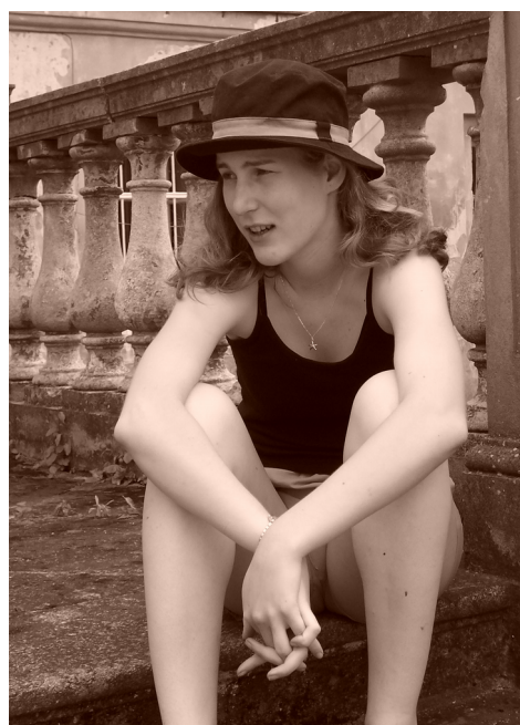
Pavlova oblíbená fotka