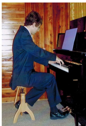
... či hraje na klavír