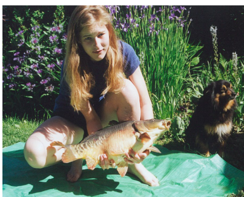
... navštěvuje rybářský kroužek