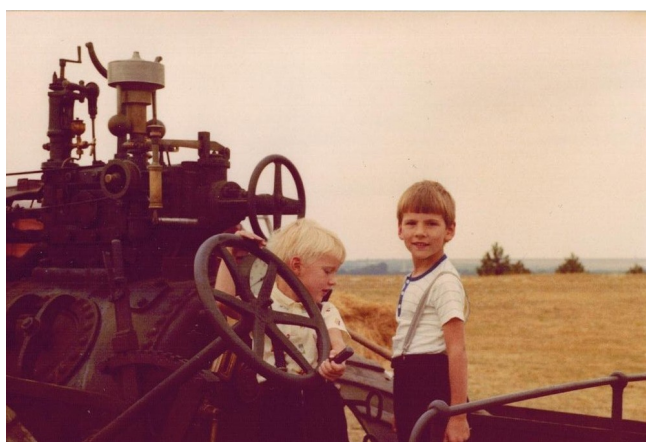
Již v mládí jsme měli ...