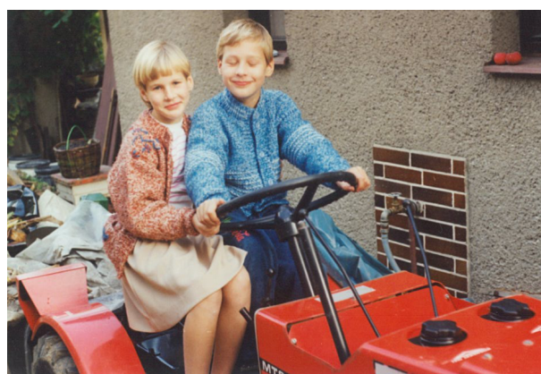
... některé zájmy společné!